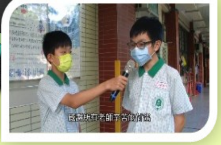
感謝所有老師辛苦培育