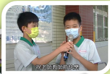
祝老師教師節快樂