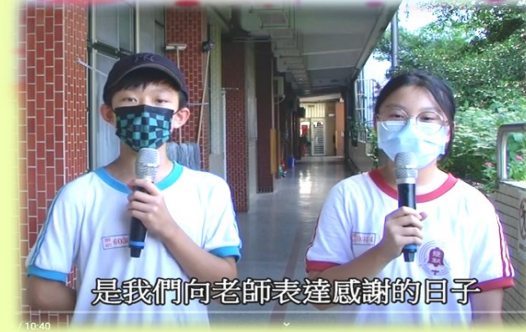
是我們向老師表達感謝的口子

一年一度的教師節到來，為培養尊師重道的感恩情懷，學務處和自治市長在疫情中，特別安排低移動、低接觸的活動，讓學生表達對老師的感謝之情。