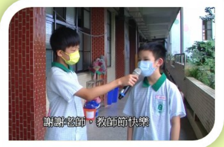
謝謝老師，教師節快樂